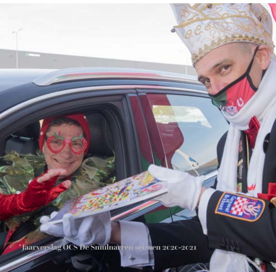
Jaarverslag OCS De Smulnarren seizoen 2020-2021